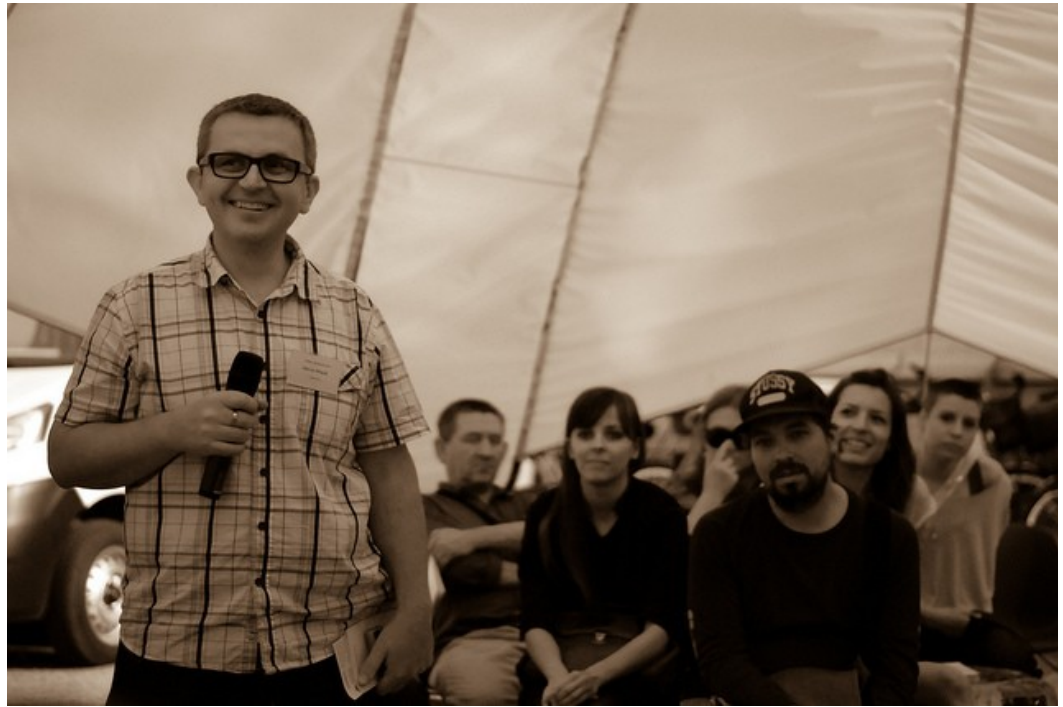
Panel dyskusyjny