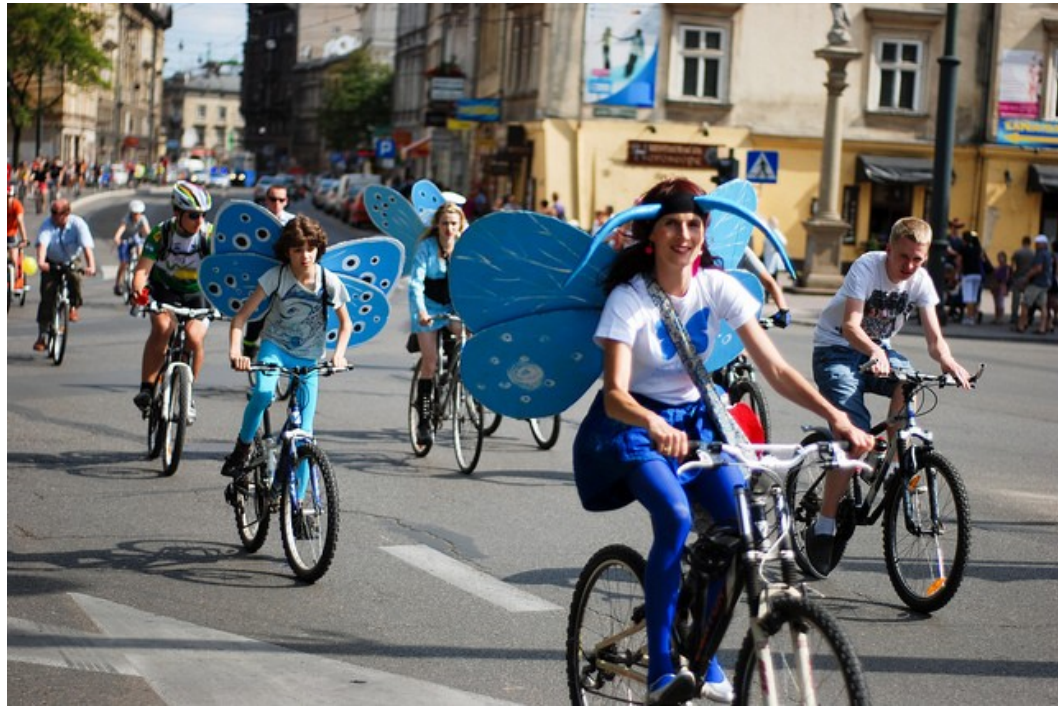
Uczestnicy Wielkiego Przejazdu Rowerowego