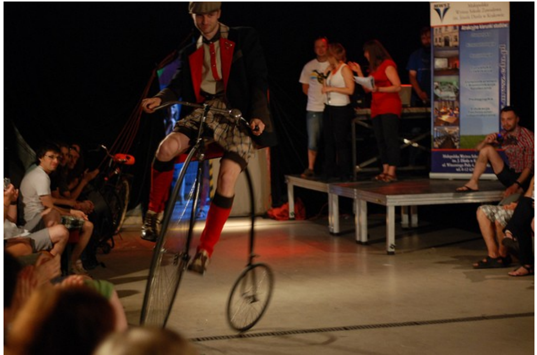
Pokaz mody rowerowej