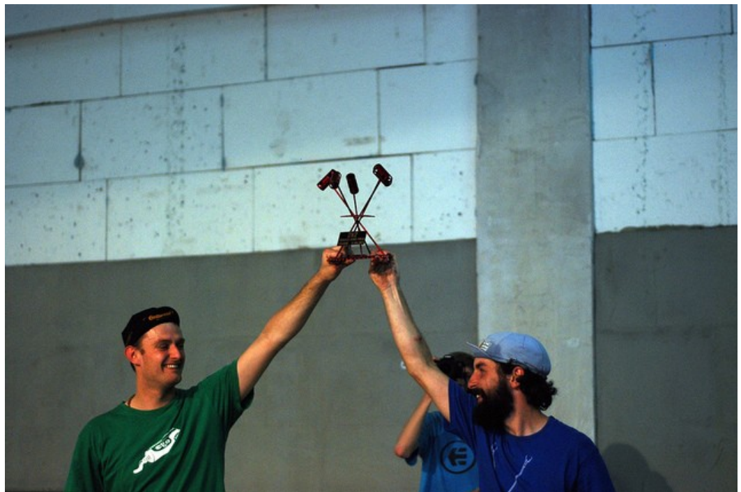
Final turnieju Bike Polo