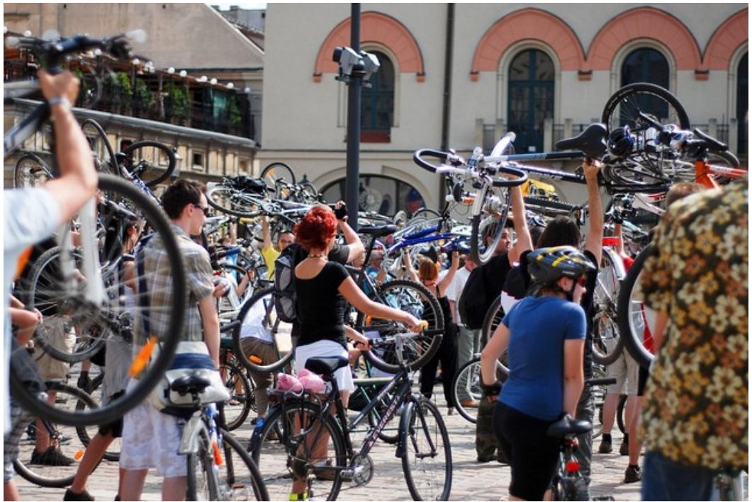
Początek Wielkiego Przejazdu Rowerowego na Placu Szczepańskim

Więcej zdjęć oraz relację z ubiegłorocznej edycji Święta Cyklicznego można znaleźć na portalu I Bike Kraków .