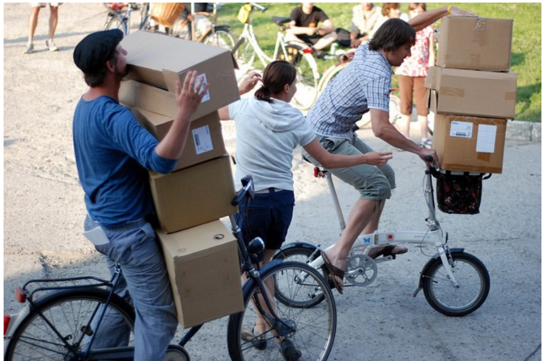
Konkurs podczas finału Święta Cyklicznego