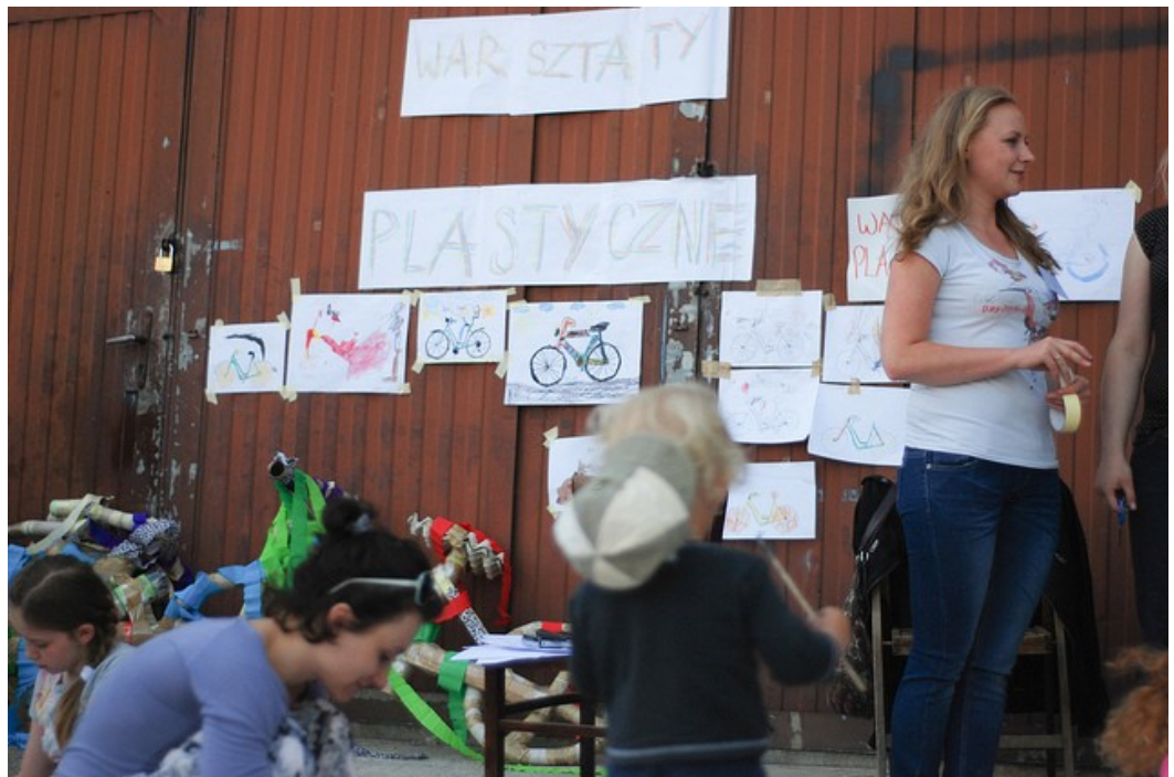
Warsztaty dla dzieci